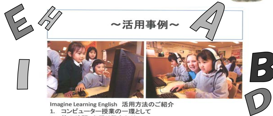
Imagine Learning English 活用方法のご紹介 1. コンピューター授業の一環として 2. 休み時間、お残り保育など