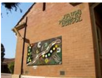
現地の学校の様子